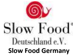
Slow Food Germany