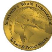
Sharkman's World Organization