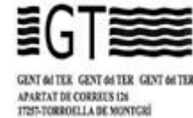
Gent del Ter