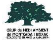
Grup de Medi Ambient de Montcada i Reixac