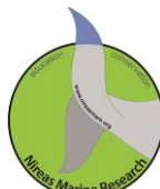
Nireas Marine Research