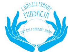
Fundacja Z Naszej Strony