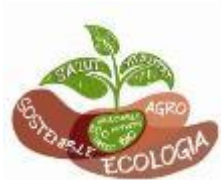
Associació Salut i Agroecologia (ASiA)