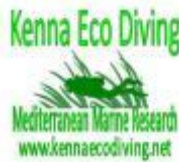
Kenna Eco Diving