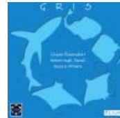
Gruppo Ricercatori Italiani sugli Squali razze e chimere