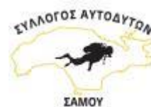
Samos Divers Association