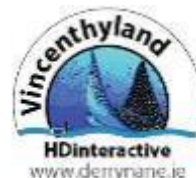
HD Interactive Publishing