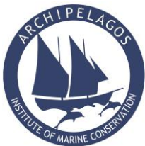
Archipelagos Institute of Marine Conservation