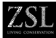
Zoological Society of London (ZSL)