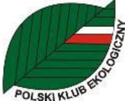
Polski Klub Ekologiczny Zarząd Główny