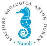
Stazione Zoologica Anton Dohrn